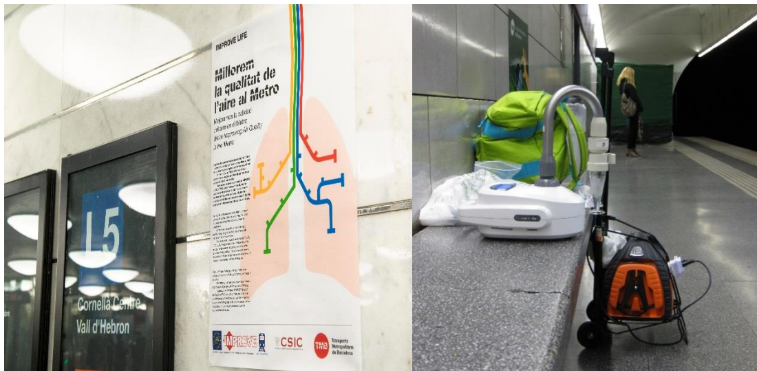
Fotografía 2.