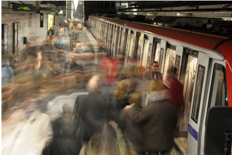
Fotografía 1. Pasajeros en una estación de la línea 2 de metro (TMB).