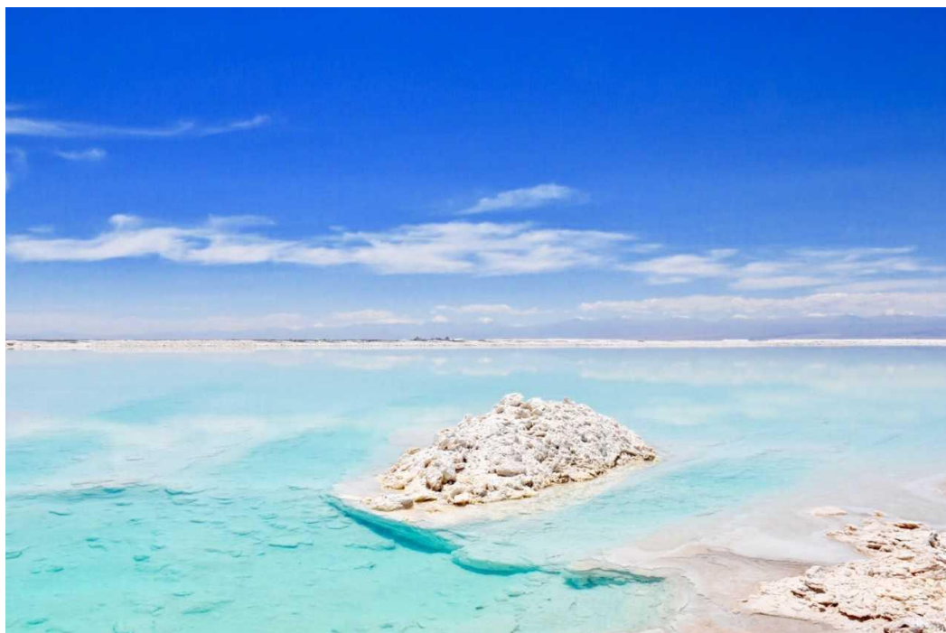
Salinas del desierto de Atacama, en Chile